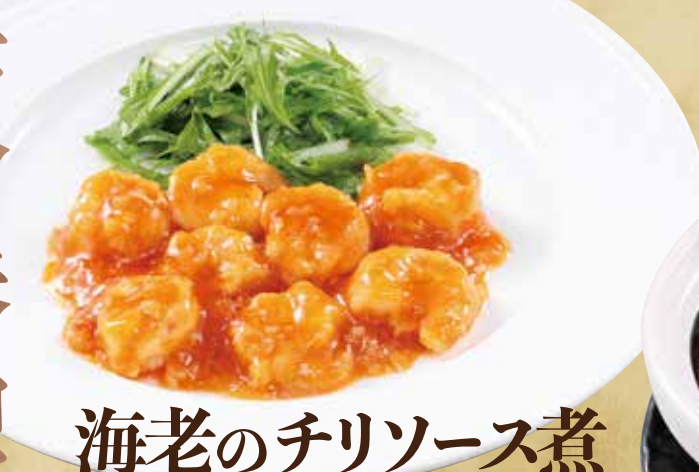
海老のチリソース煮