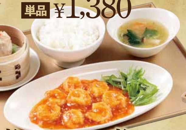
海老のチリソース煮セット