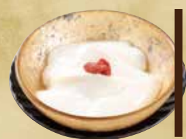
とろ〜り あんにとろ豆腐 ¥400