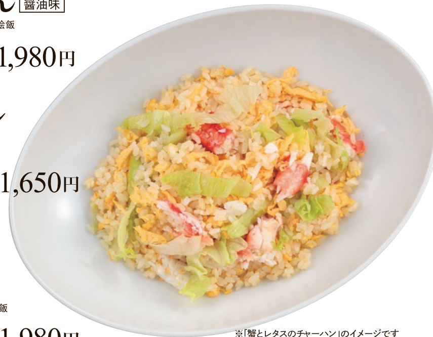
※「蟹とレタスのチャーハン」のイメージです