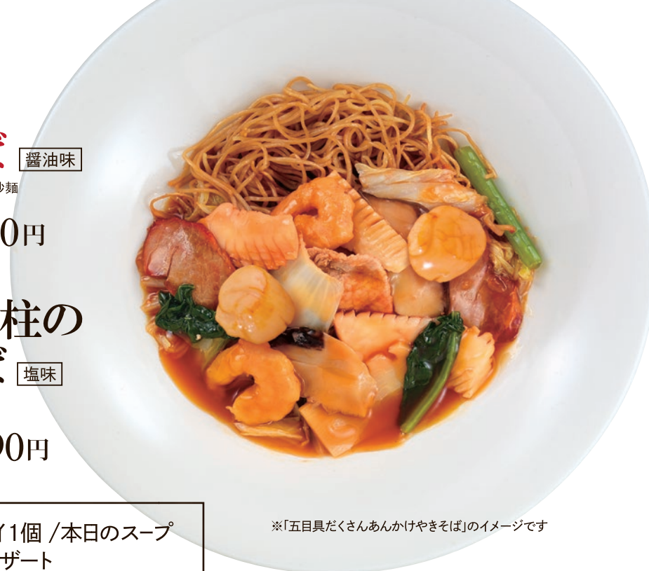
※「五目具だくさんあんかけやきそば」のイメージです