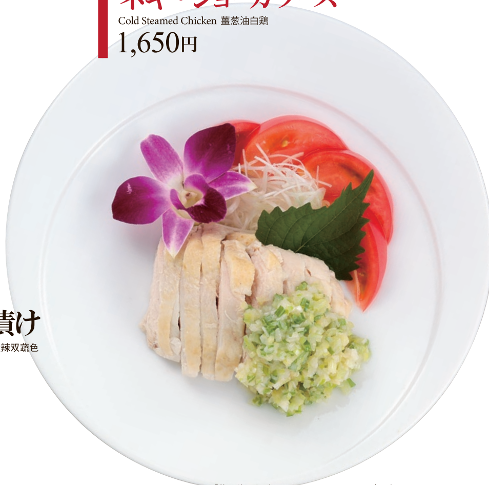
※「蒸し鶏のネギ・ショウガソース」のイメージです