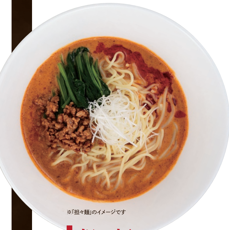
※「担々麺」のイメージです