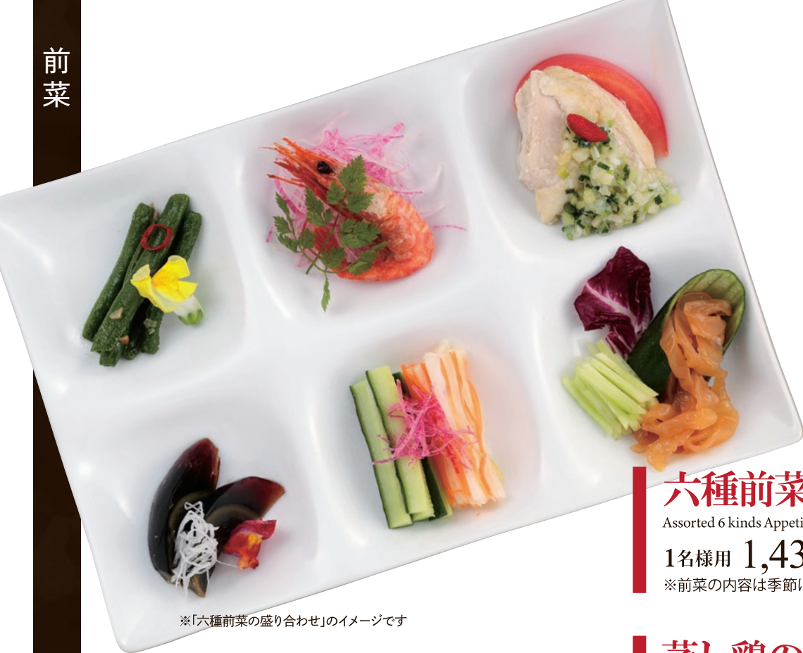
※「六種前菜の盛り合わせ」のイメージです