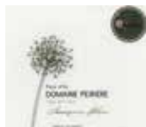
ペイリエール バイドック ソーヴィニヨンブラン デザールヌー Domaine Peiriere Pays d'Oc Sauvignon Blanc Des Arts Nus [フランス・ラングドック 辛口] ■ソーヴィニヨンブラン100%

グラス 830円(税別) 913円(税込) カラフェ 2,450円(税別) 2,695円(税込) ボトル 4,850円(税別) 5,335円(税込)