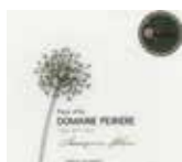
ペイリエール バイドック ソーヴィニヨンブラン デザールヌー Domaine Peiriere Pays d'Oc Sauvignon Blanc Des Arts Nus [フランス・ラングドック 辛口] ■ソーヴィニヨンブラン100%

グラス 830円(税別) 913円(税込) カラフェ 2,450円(税別) 2,695円(税込) ボトル 4,850円(税別) 5,335円(税込)