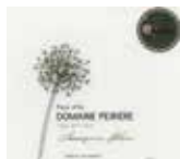
ペイリエール バイドック ソーヴィニヨンブラン デザールヌー Domaine Peiriere Pays d'Oc Sauvignon Blanc Des Arts Nus [フランス・ラングドック 辛口] ■ソーヴィニヨンブラン100%

グラス 830円(税別) 913円(税込) カラフェ 2,450円(税別) 2,695円(税込) ボトル 4,850円(税別) 5,335円(税込)