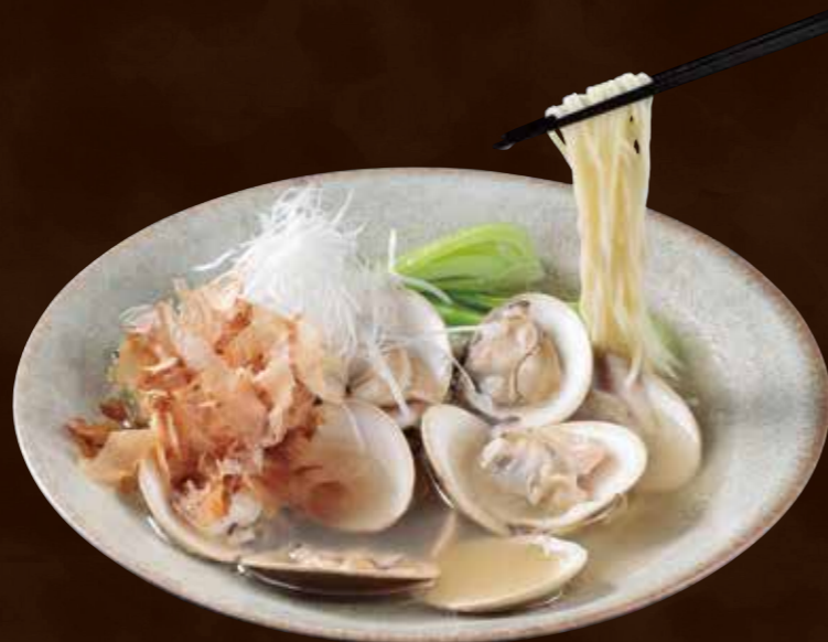
茨城県鹿島灘産大粒蛤の あっさり清湯そば Light Chinese Noodles in Clear Soup with Large Clams from Kashimanada in Ibaraki