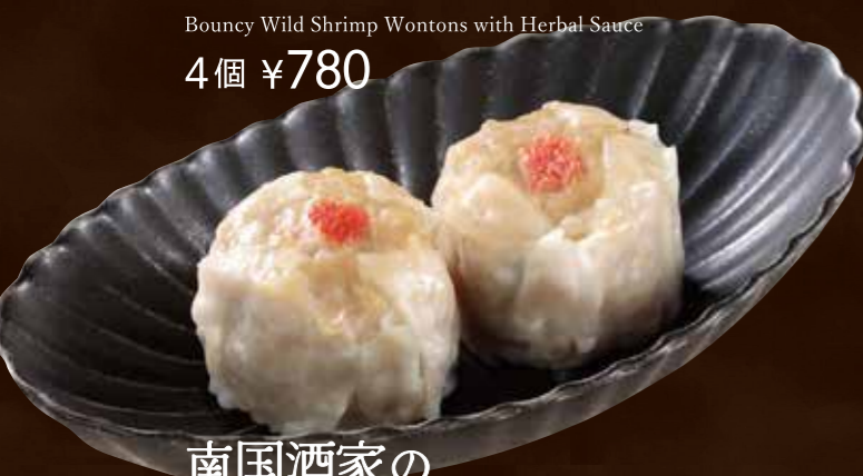
南国酒家の お肉たっぷりシュウマイ