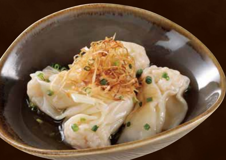
天然海老のぷりぷり海老雲呑 香味ソース

Bouncy Wild Shrimp Wontons with Herbal Sauce