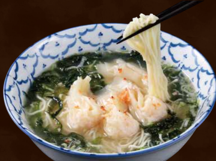
天然海老の ぷりぷり海老雲呑麺 ～国産 あおさのりの香り～ わんたんめん

Wonton Noodles with Bouncy Wild Shrimps, Flavored with Sea Lettuce