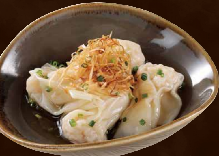
天然海老のぷりぷり海老雲呑 香味ソース

Bouncy Wild Shrimp Wontons with Herbal Sauce