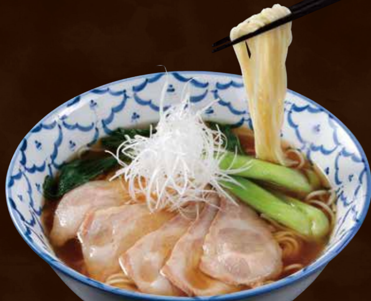
群馬県産もち豚 低温ローストチャーシューの清湯そば Chinese Noodles in Clear Soup with Sous Vide Roasted Char Siu Pork Using Mochibuta Pork from Gunma