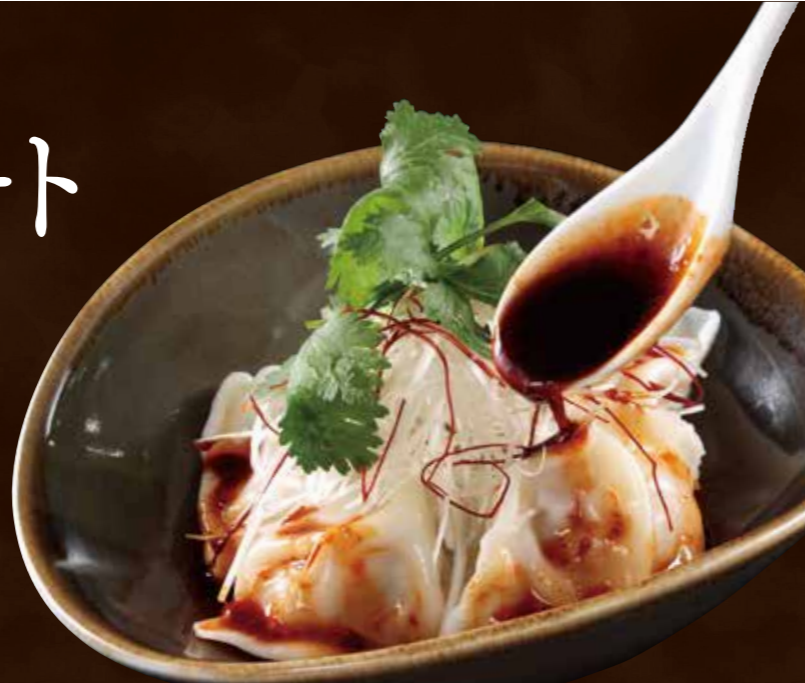
水餃子の辛しソース パクチーを添えて

Boiled Dumplings with Mustard Sauce, Served with Coriander