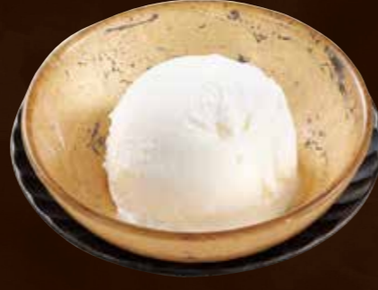
昔なつかしバニラアイス