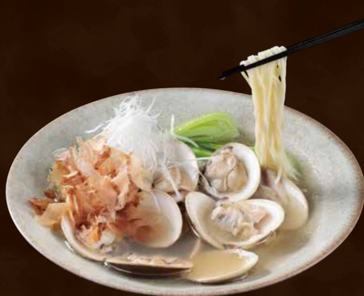
茨城県鹿島灘産大粒蛤の あっさり清湯そば Light Chinese Noodles in Clear Soup with Large Clams from Kashimanada in Ibaraki