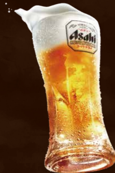
アサヒ スーパードライ (生) 330ml ¥750