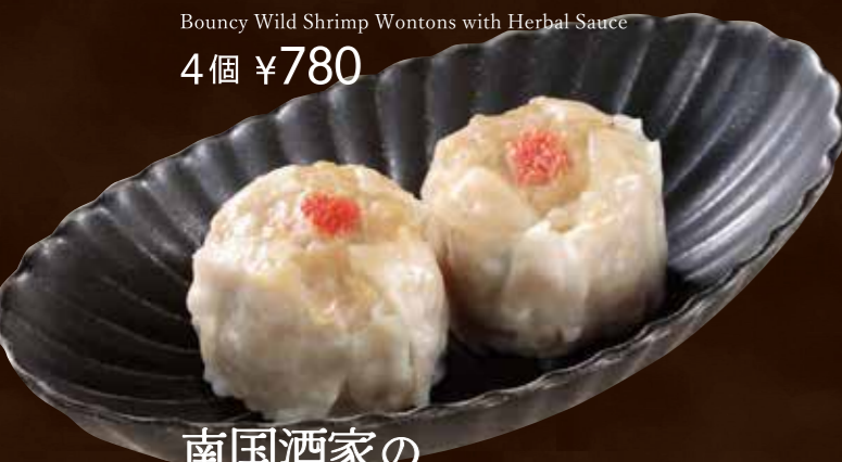
南国酒家の お肉たっぷりシュウマイ