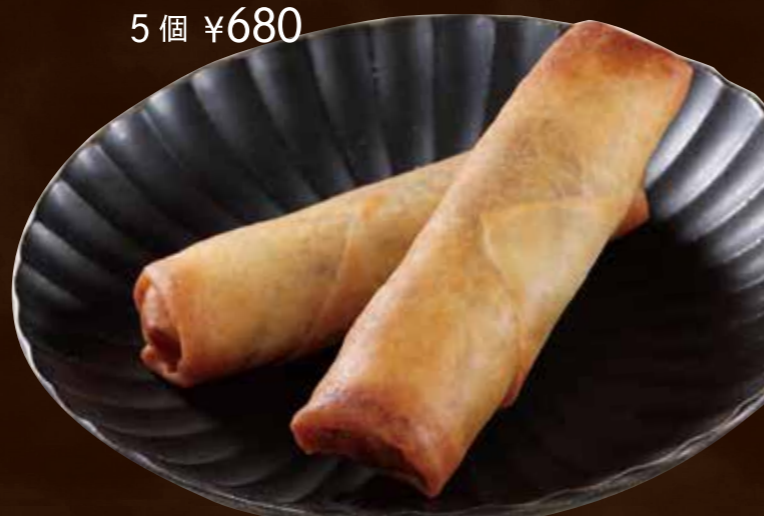
五目具だくさん春巻き

Spring Rolls Filled with Various Ingredients