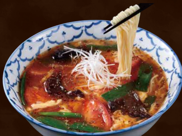
鳥取県境港産 紅ずわい蟹と 厳選トマトの酸辣湯麺 宮崎県産柚子胡椒の香り すーらーたんめん

Hot and Sour Soup Noodles with Red Snow Crab from Sakaiminato in Tottori and Tomatoes, Flavored with Yuzu Pepper from Miyazaki.