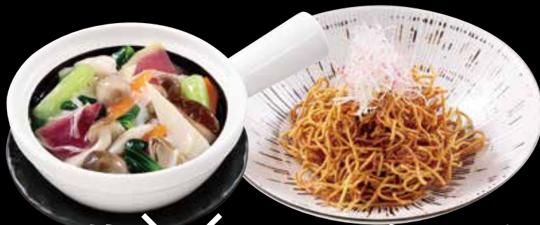
野菜 × かたやきそば