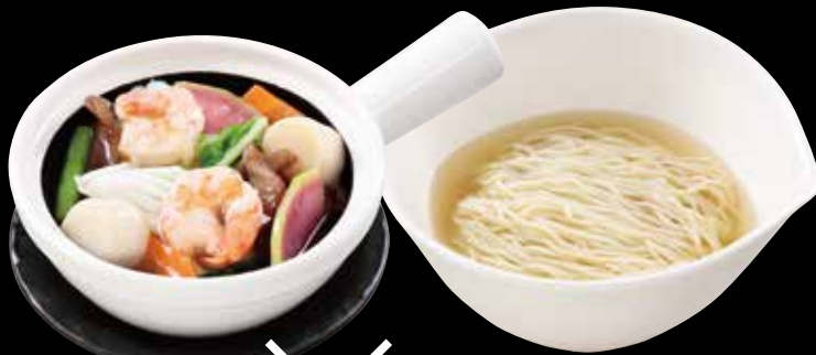
海鮮 × つゆそば