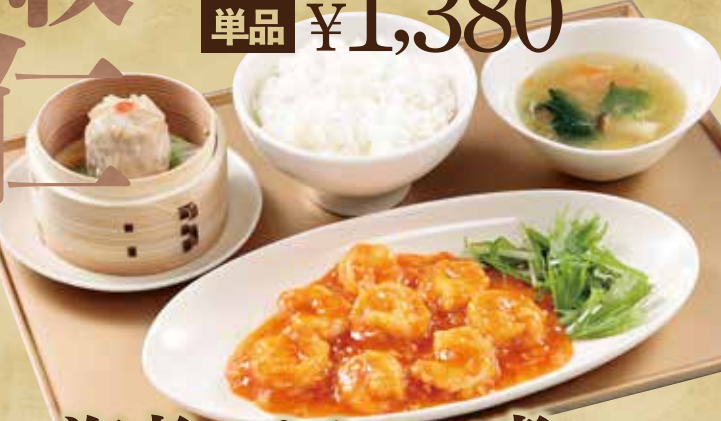
海老のチリソース煮セット