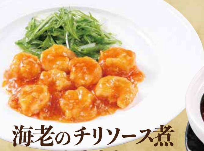
海老のチリソース煮