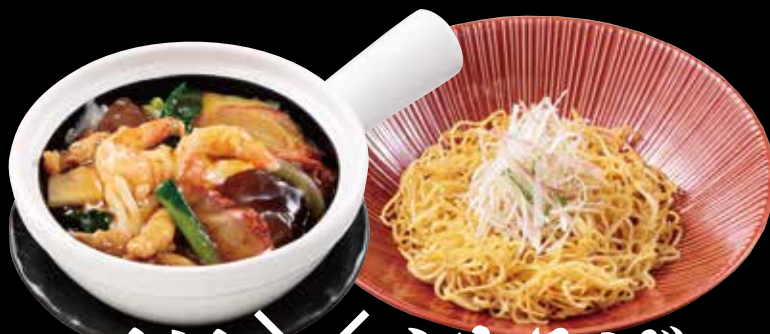
五目 × やきそば